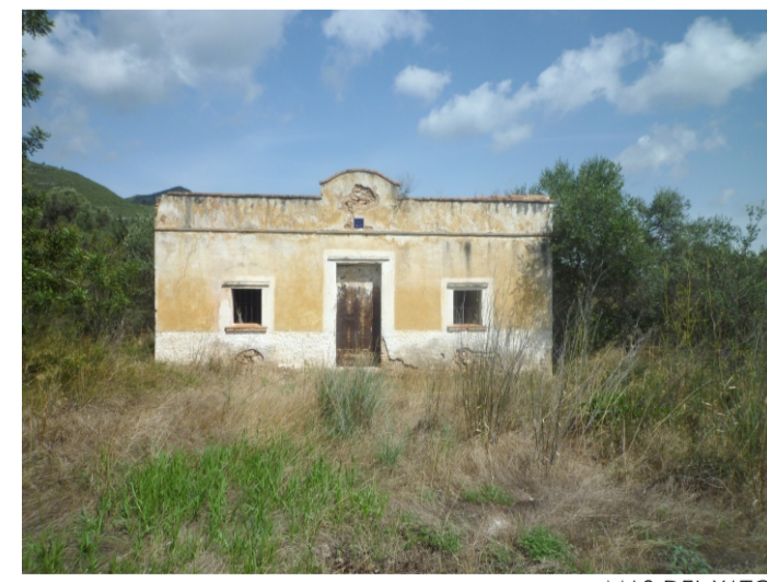
MAS DEL XATO