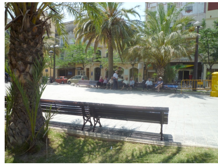
PLAÇA DEL COC