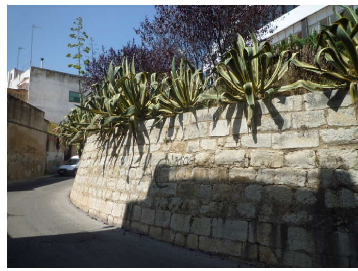
RESTES D'UN MUR DEL CASTELL