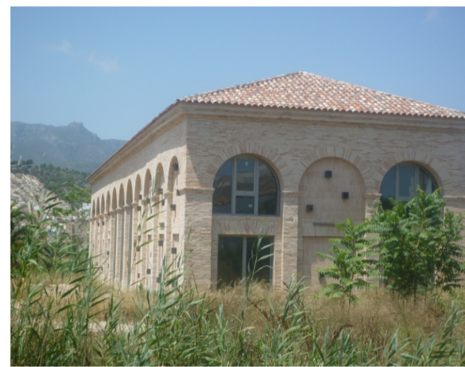
LA CASOTA "ANTIGA ADUANA"