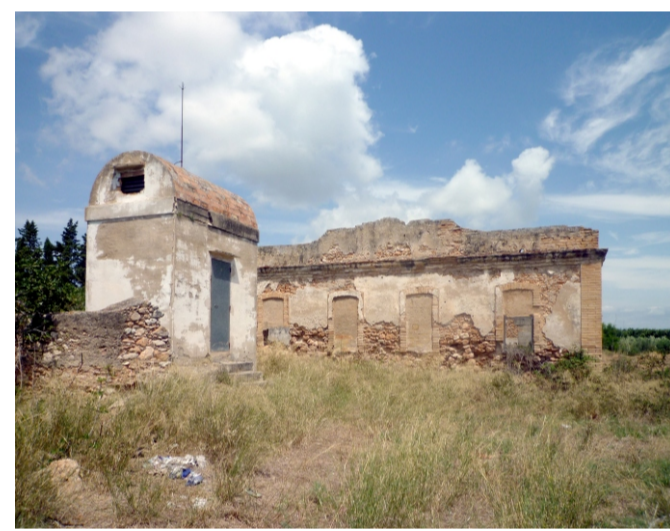
COHETERA I MASIA DELS CARABINERS