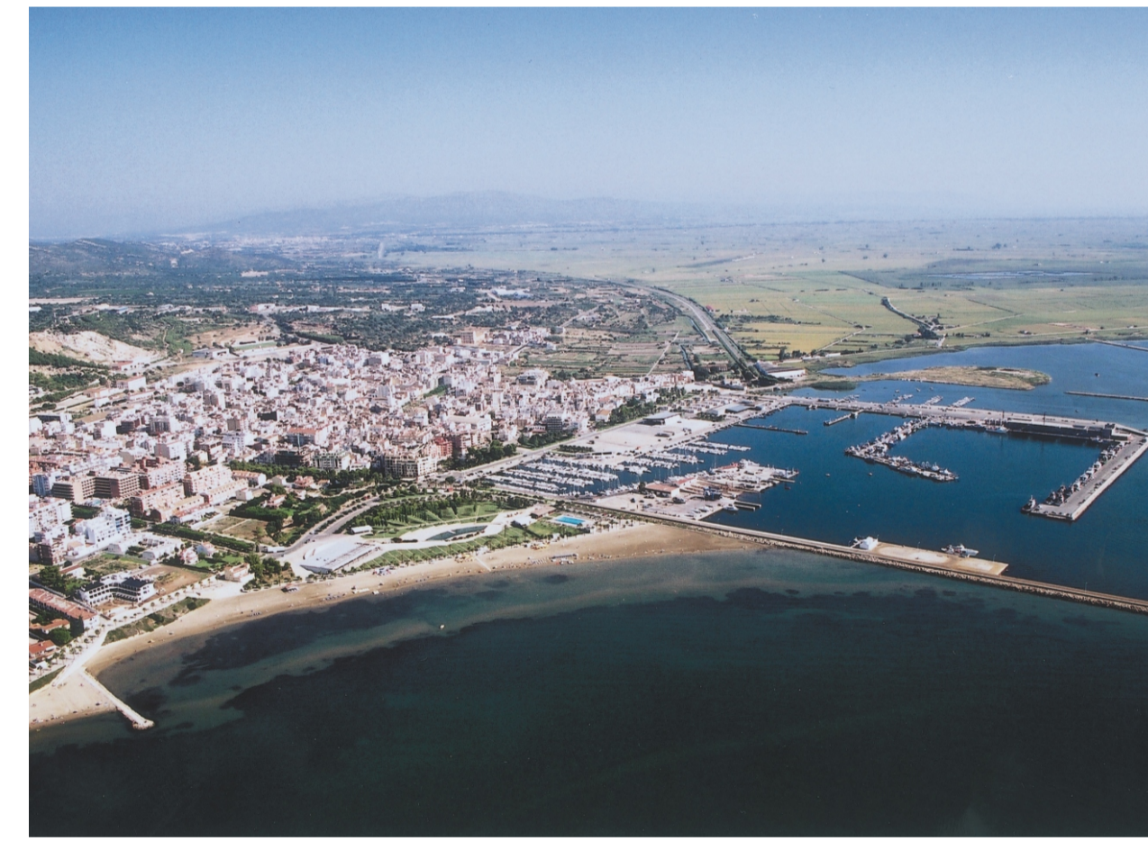
IMATGE AÈRIA DES DEL SUD