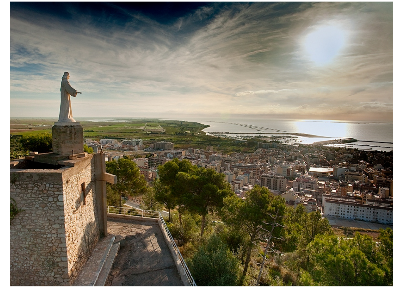
PANORÀMICA DES DE GUARDIOLA