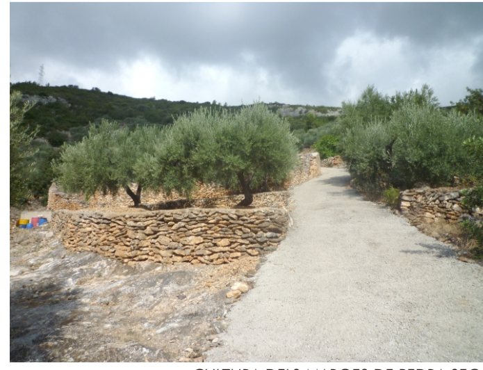
CULTURA DELS MARGES DE PEDRA SECA