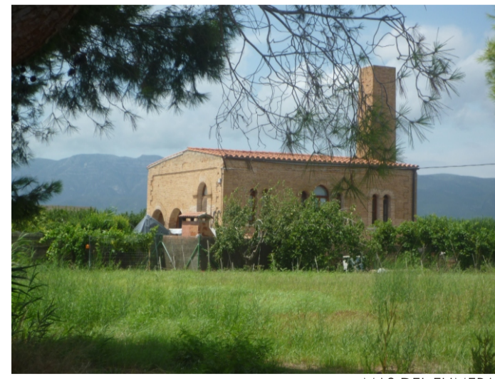
MAS DEL FUMERAL