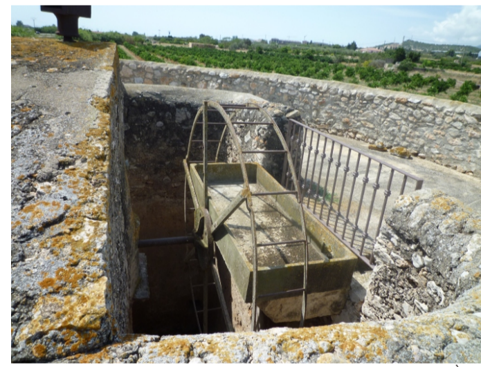
FINCA FERRER (NÒRIA)