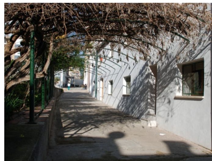
CENTRE CULTURAL "EL MASET"