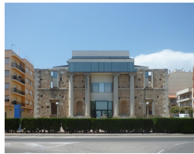
RESTES DE L'ESGLÉSIA NOVA BASTIDA A LA IL·LUSTRACIÓ