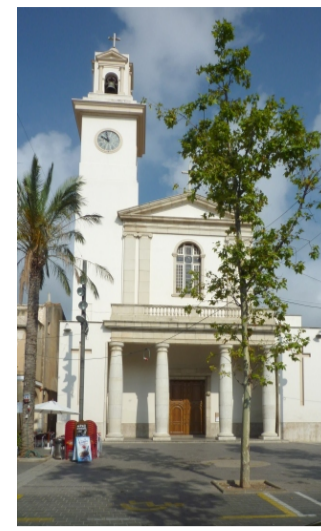
ESGLÉSIA DE LA SANTÍSSIMA TRINITAT