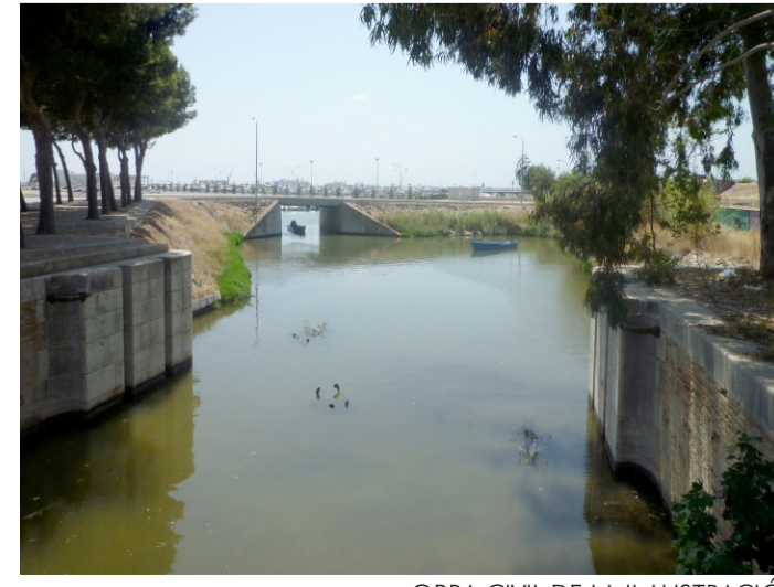
OBRA CIVIL DE LA IL·LUSTRACIÓ