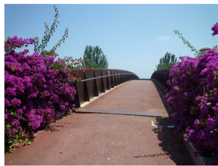
PASSARELLA D'UNIÓ AMB EL PASSEIG MARÍTIM