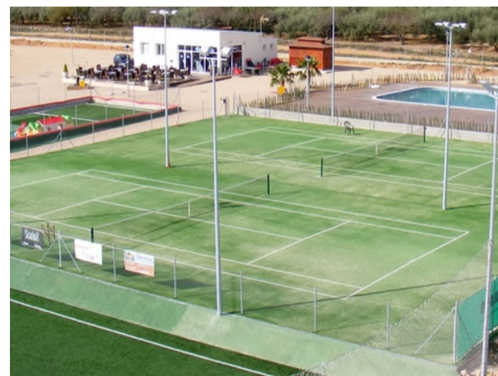
CENTRE ESPORTIU JOHN Y MONTANÉS