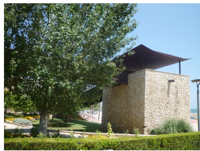
TROBADA DEL PASSEIG MARÍTIM AMB LA PASSARELLA