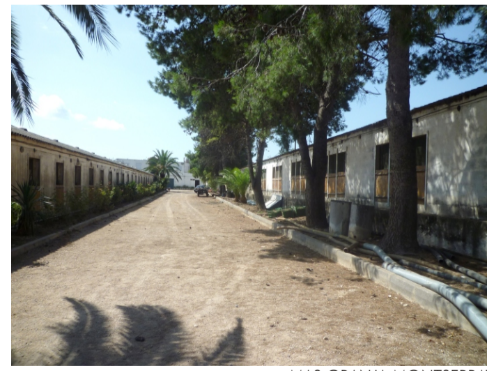
MAS GRANJA MONTSERRAT