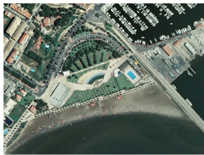
PARC DE GARBI