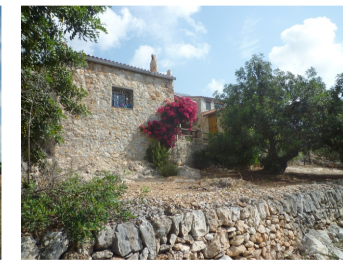
CORRAL DEL PANTONI