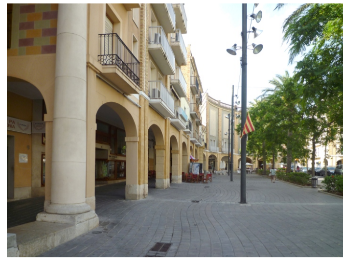
SALÓ CARLES III