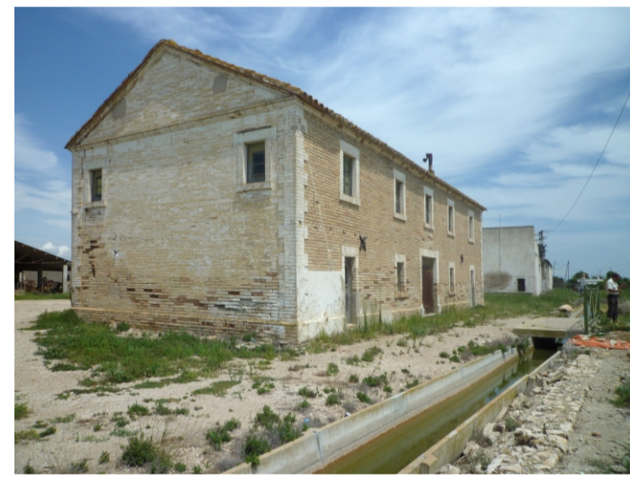
LA CASA BLANCA