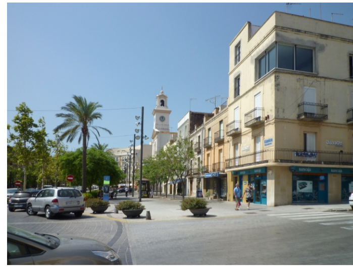
SALÓ CARLES III