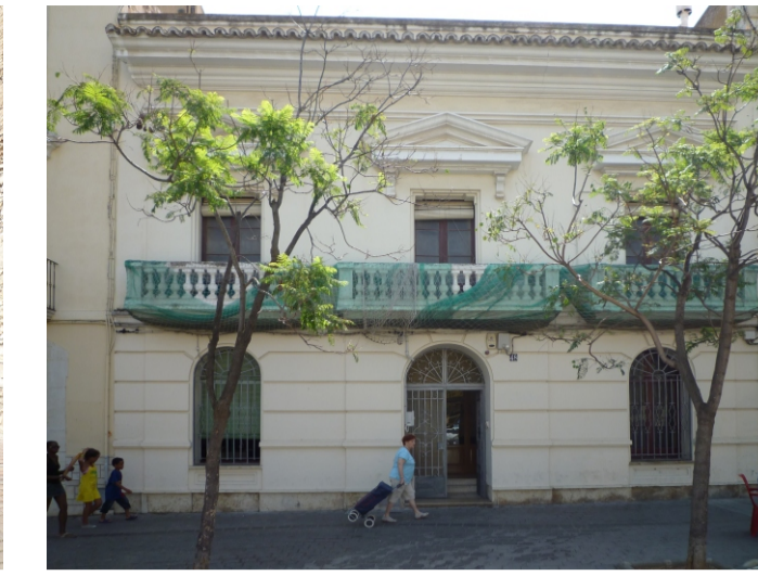
EDIFICI ANTIC "ADUANAS"