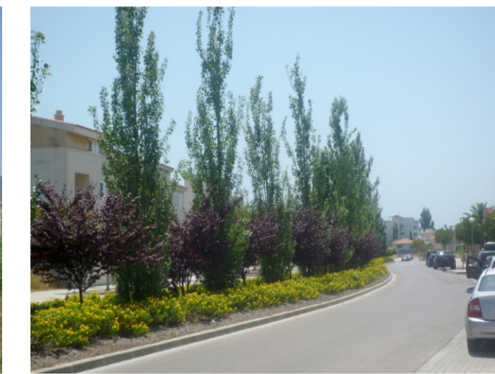
ZONA RESIDENCIAL LA VILA DEL FAR