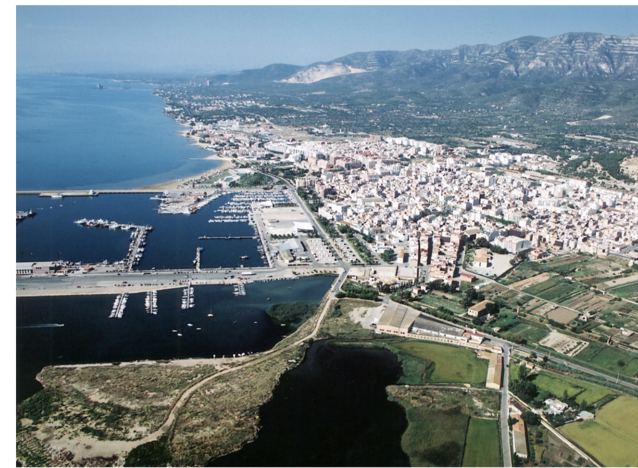
IMATGE AÈRIA DES DEL NORD