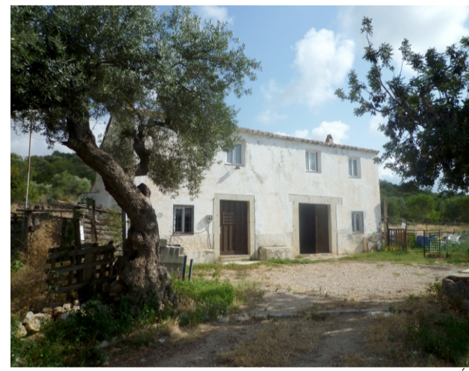
MAS DE LA CANICIA