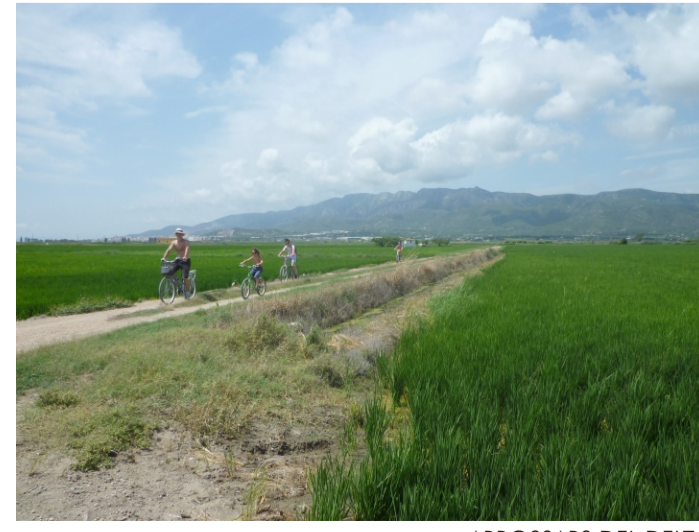
ARROSSARS DEL DELTA