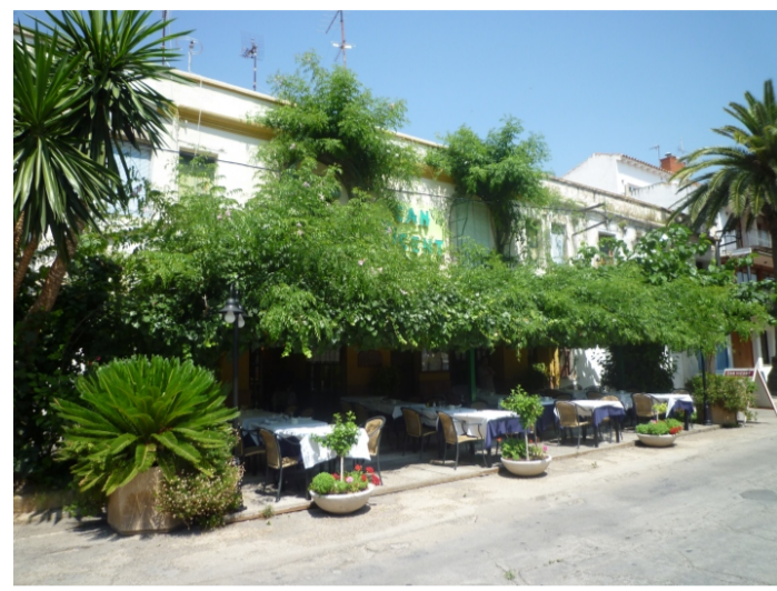
ANTIGUES CASES DE PESCADORS