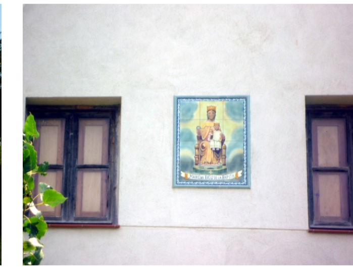
MAS DE L'AMIGO