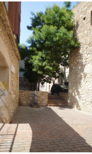
ANTIC ASSENTAMENT DE LA RÀPITA CARRERÓ DEL CONVENT