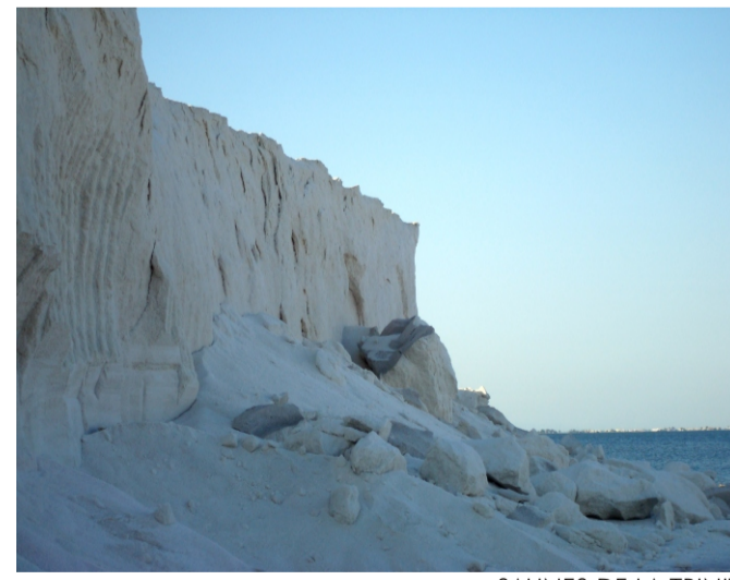
SALINES DE LA TRINITAT