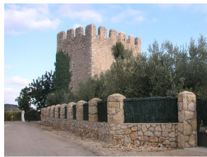
LA TORRE DEL MORO