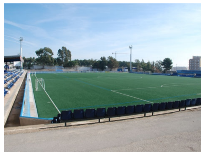
CAMP MUNICIPAL D'ESPORTS