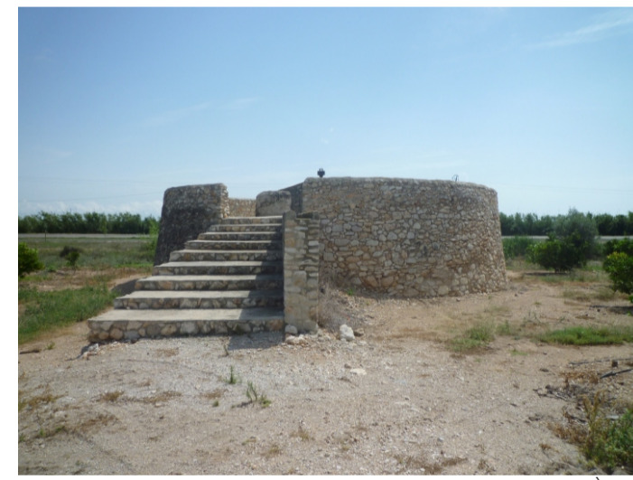
FINCA FERRER (NÒRIA)