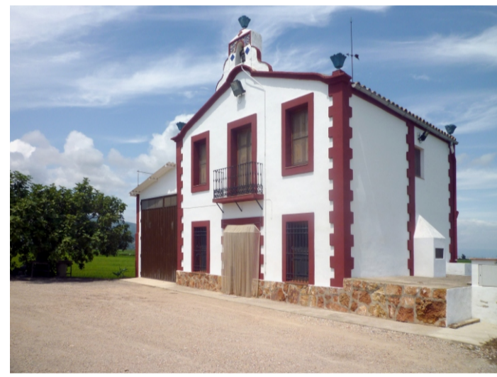
MAS DE LA CAMPANA (O DE BUERA)