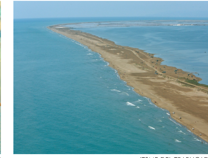
ITSMES DEL TRABUCADOR