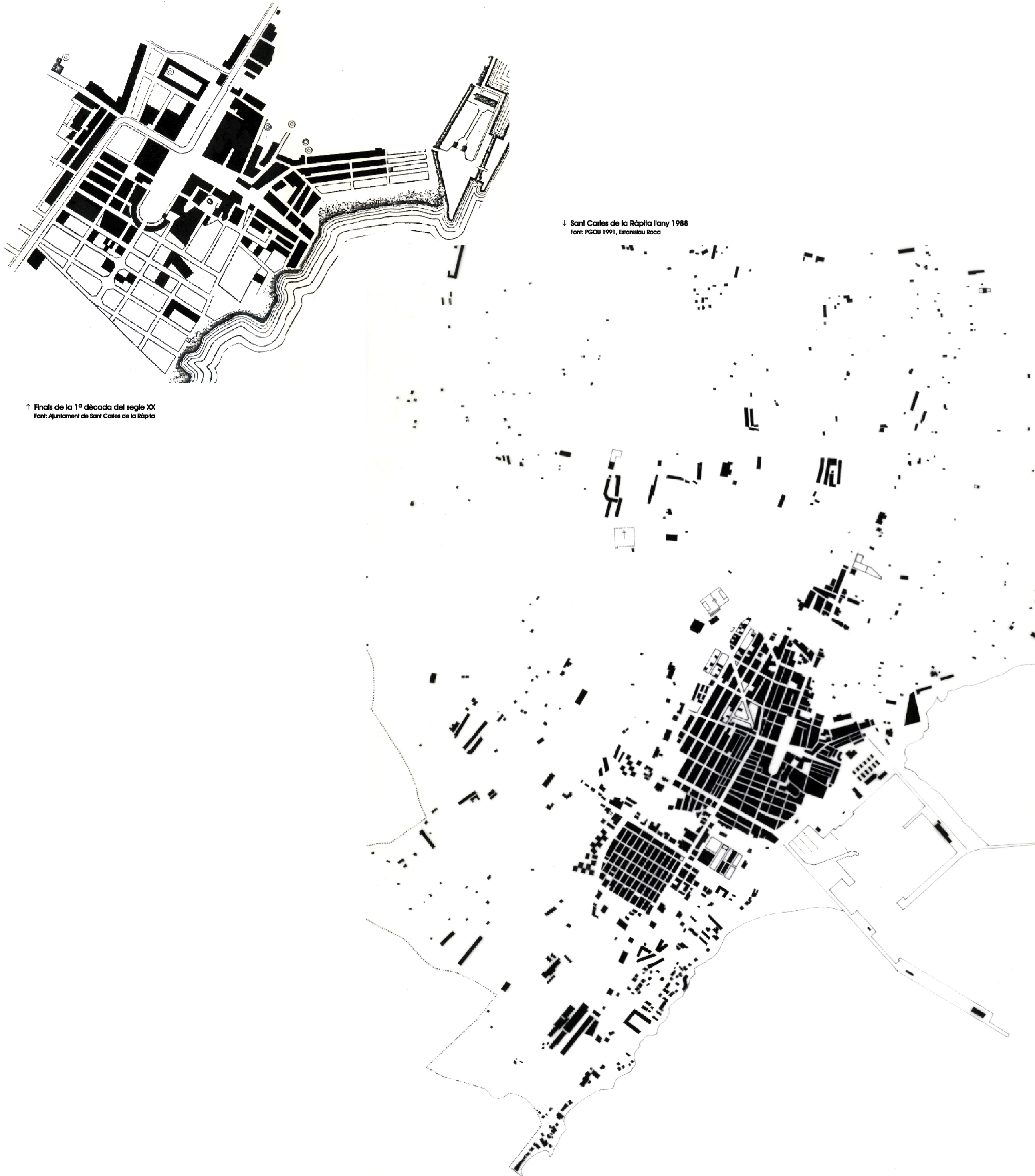
1 Sant Carles de la Ràpita l'any 1988